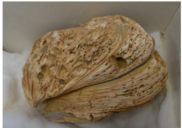
← 17cm →

これは、1500 万年前（新世代第 3 紀）の化石です。化石が採集されたのは内浦層群と呼ばれる大浦半島の地層です。巨大カキは、河口や入江の汽水（海水と淡水が混じたところ）に群れになって生息していました。大きなものは殻の長さが 60cm にもなりましたが、今は絶滅してしまいました。この化石は、長さ 17cm で、2～3 年目の巨大カキの子どもです。1966 年 8 月に採集され、今回ふるさと発見館に寄贈して頂きました。