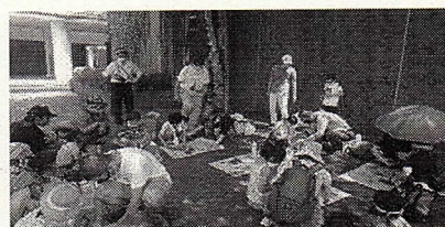
「ネイチャーランド」