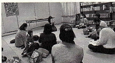
「赤ちゃんえほんのひろば」