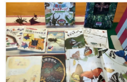
▲加佐公民館昆虫展での本の展示

東・西図書館や各分館で借りた本はどここの図書館でも返却することができます!ぜひ、利用してください。