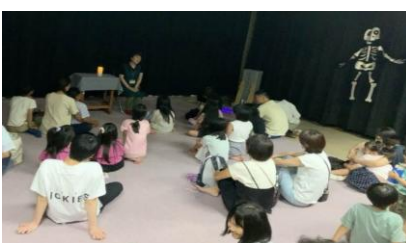
「こわ～いおはなし会」