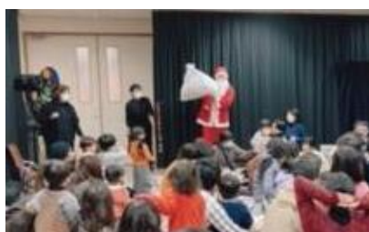
「冬のおたのしみ会」