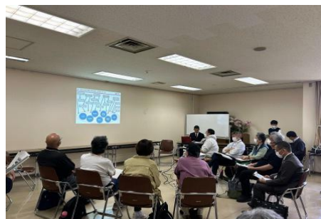
第1回懇談会の様子