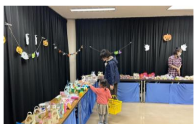
「おみせやさんごっこ」