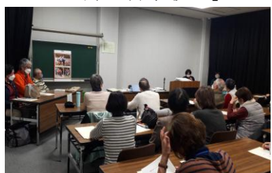
「移動図書館『てくてく』が やってくる」