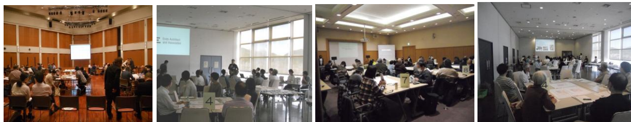
第1回～第4回ワークショップの様子