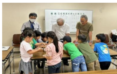
「ネイチャーランドー化石発掘ー」