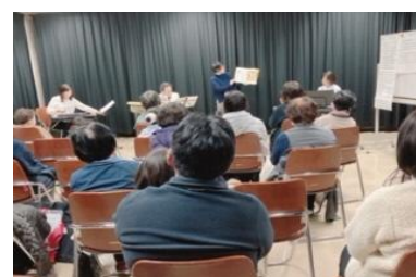
「ナイトライブラリー」