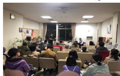
「夜のちょっとコンサート」