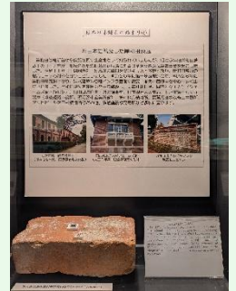
→岸和田煉瓦のれんがの展示