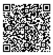
↑文化遺産オンライン内赤れんが博物館ページ

2026年2月末より当館が常設展示している資料の一部が、日本全国の文化遺産を網羅する文化庁のアーカイブサイト「文化遺産オンライン」でご覧いただけるようになりました。