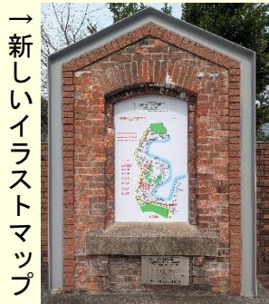
→新しいイラストマップ

2月24日、当館前庭にある「れんがアーチ壁」に新しい案内マップを設置いたしました。このアーチに使用されているのは、1891(明治24)年に竣工した旧大阪麦酒会社(現アサヒビール株式会社)吹田村醸造所の貴重なれんがです。