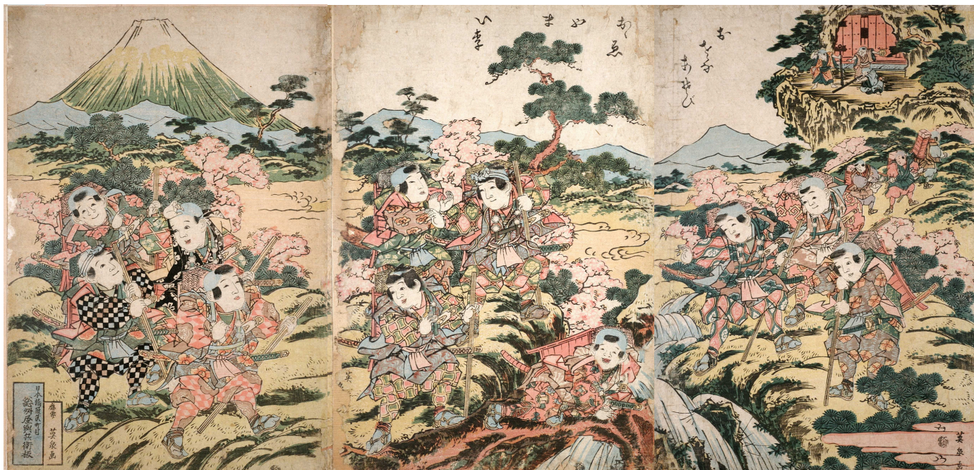
「おさなあそびおおえやまいり」 けいさいえいせん 漢齋英泉 糸井文庫

今月の糸井文庫コーナーでは、春らんまんの浮世絵、 けいさいえいせん 漢齋英泉筆「おさなあそびおおえやまいり」をご紹介します。この作品は、ある主題を別のものになぞらえて描く、当時流行した「見立画」 みたてえ の一つです。本作では勇猛な「源頼光と四天王の一行」を愛らしい幼子の姿に見立てて描いています。本来であれば鬼退治に向かう勇ましい場面ですが、富士山を背景にお花見を楽しむ様子は実になごやかです。鬼の窟の門番までもが子供として描かれており、まるで微笑ましい「ごっこ遊び」 おに いわや のようです。春の陽気に包まれた、遊び心あふれる江戸の「見立て」の世界をぜひお楽しみください。