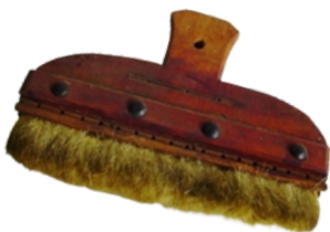
傘作りで使う刷毛