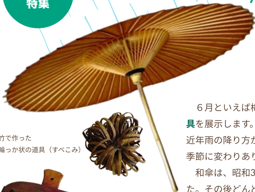
竹で作った 輪っか状の道具（すべこみ）