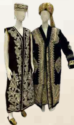
ウズベキスタン 民族衣装