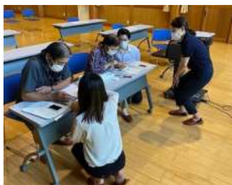
▲アプリ体験会の様子