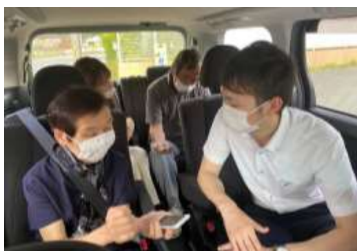
▲meemo 相談会での模擬送迎