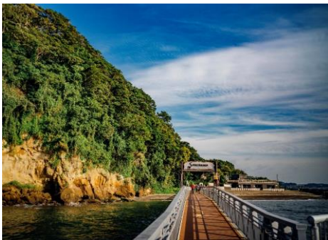
横須賀（猿島砲台跡）