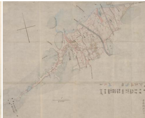
①東舞鶴の都市計画図（明治時代）