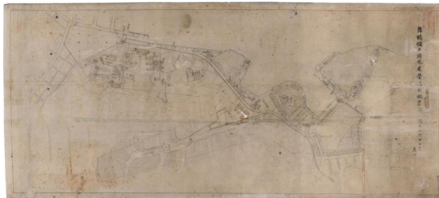
②明治44年に作成された鎮守府の建物配置図