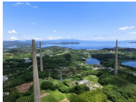
佐世保（針尾送信所）