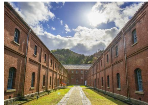
舞鶴（赤れんがパーク）