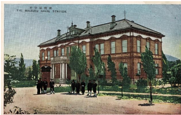
舞鶴鎮守府司令部（絵はがき）