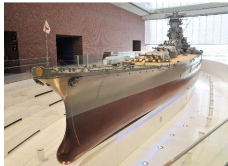
呉（大和ミュージアム）