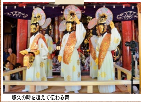
悠久の時を超えて伝わる舞

国の重要無形民俗文化財に指定されている仏舞が松尾寺で行われました。僧侶による読経の後、本堂内の舞台上で金色の面をつけた大日・釈迦・阿彌陀如来に扮した舞人が雅楽に合わせて舞いを披露し、参拝した人たちは優雅な舞に見入っていました。 仏舞は奈良時代に中国の唐から伝えられた舞楽が伝播したものとわれ、松尾寺では約600年前に始まったと伝えられています。もともとは釈迦が生まれたとされる旧暦の卯月8日の行事でしたが、新暦になって5月8日の花祭りの日に行われるようになりました。