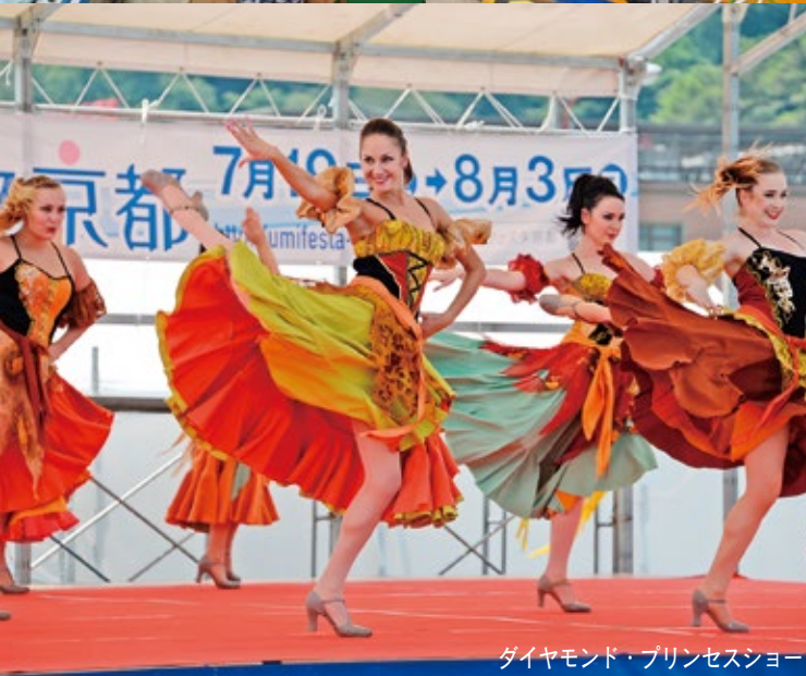
ダイヤモンド・プリンセスショー