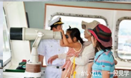
かいいい 一般見学