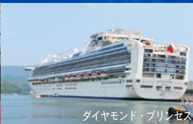
ダイヤモンド・プリンセス