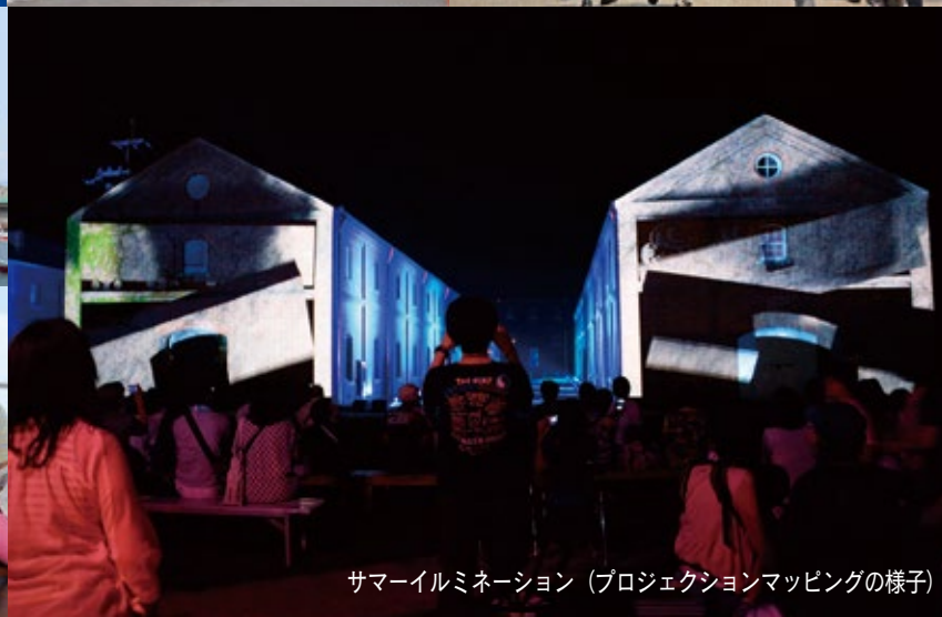
スマイルミネーション (プロジェクションマッピングの様子)