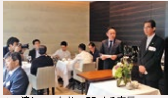
▲一流シェフなどへPRする市長

舞鶴の地場産品を首都圏でPRする「食の匠活用事業～舞鶴の七夕を味わう会～」を7月7日、東京都内のフレンチレストラン「ランベリー」