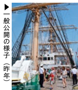
▶一般公開の様子(昨年)