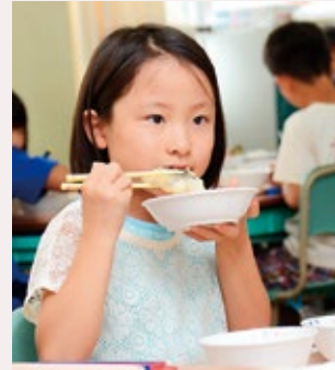
▲給食にスズキのムニエルが登場

舞鶴のさかなの魅力発信による消費拡大を目的に「舞鶴の旬の特鮮さかな」18種類を選定しました。選定基準は「舞鶴地方卸売市場で取り扱われている」「おいしい旬のさかな」「伝統的な加工品を含む」「地域性をアピールできる」など。