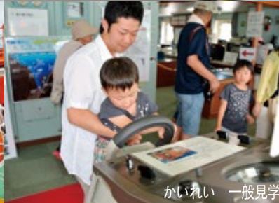
かいいい 一般見学