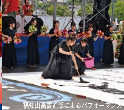
福知山高書道部によるパフォーマンス