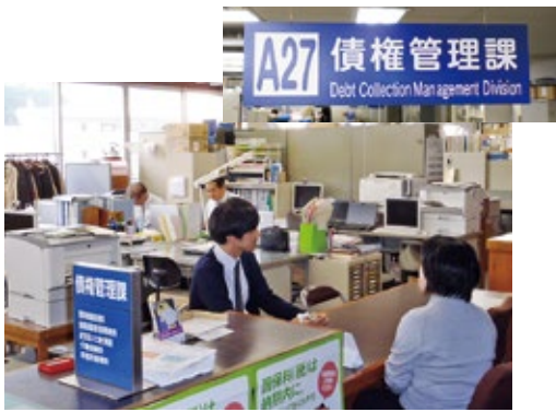
▲新設された債権管理課（市役所本館2階）

舞鶴市債権管理条例（抜粋） （目的） 第1条 この条例は、市の債権の管理に関する事務の処理について必要な事項を定めることにより、その管理の適正化を図り、もって公平・公正な市民負担及び健全な行財政運営を確保することを目的とする。 （債権管理者の責務） 第4条 債権管理者は、法令又は条例若しくはこれに基づく規則の定めるところにより督促、滞納処分、強制執行、担保の提供等必要な措置をとるとともに、催告等を適正に行い、市の債権の保全、徴収等に努めなければならない。 2 債権管理者は、前項の規定の適用に当たっては、当該徴収する債権の債務者の資力の状況等を考慮しなければならない。