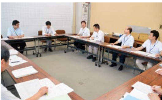
▲債権を管理する全ての組織で枠を超えての議論

そこで、全庁的に債権管理の適正化を推進するため、債権を所管する全ての課で横断的に組織する会議を設置しました。この会議における活発な議論の中で、債権管理についての課題を整理し、課題解決に向けた検討を行い、順次対策を実施してきました。