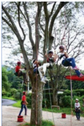
▲ツリークライミング