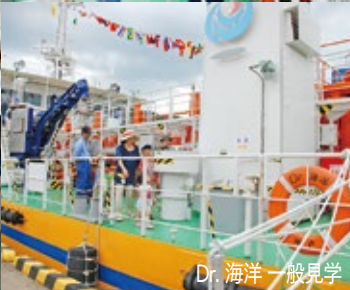
Dr. 海洋 一般見学