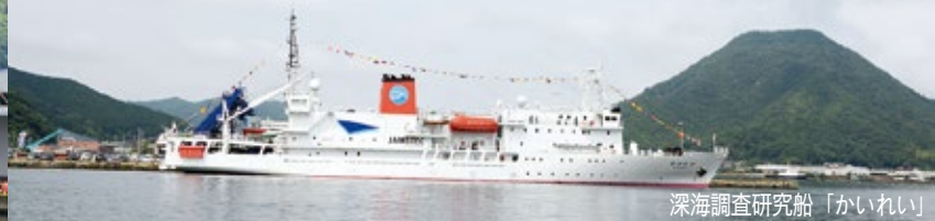
深海調査研究船「かいいい」