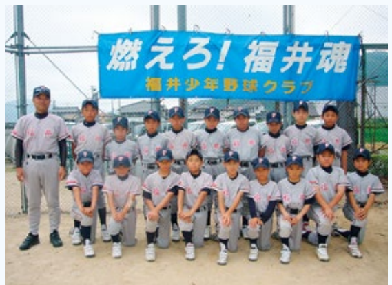
▲全国大会を前に士気を高めるクラブ生

「これまで「京都府で頂上（トップ）を 獲得」と練習に熱を入れる一方で、「サ ポートをしてきている保護者や地域 の皆さんには頭が下がります」。心・技 ・体においてチームを強くするためには 公式戦や練習試合などの実践が不可欠。 昨年は100回、今年の新年チームでも