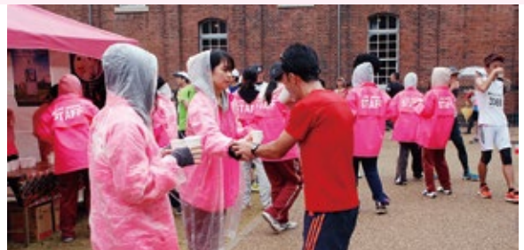
▲ランナーに飲み物を渡す大会サポーター（昨年の様子）