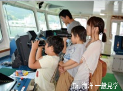
Dr. 海洋 一般見学