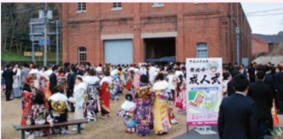
▲新成人でにぎわう赤れんがパーク（1月12日）