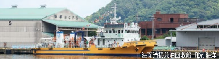
海面清掃兼油回収船「Dr. 海洋」