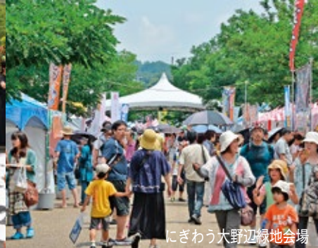
にぎわう大野辺緑地会場