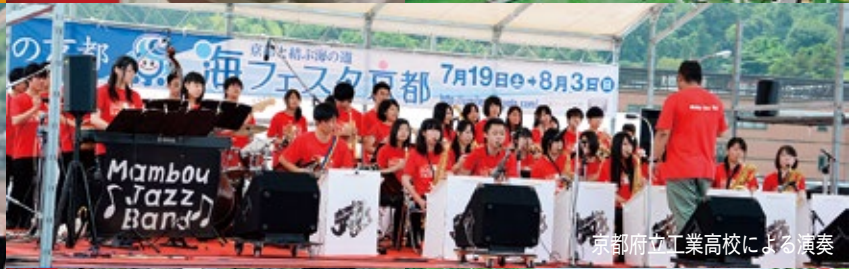
京都府立工業高校による演奏