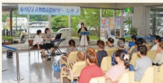
▲ロビーコンサートの様子（7月10日）

▶詳しくは、市役所ロビーコンサート実行委員会事務局（同課内、☎66・1019）へ。