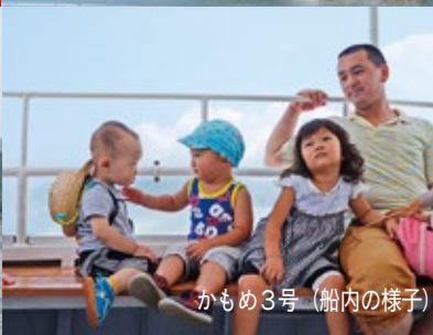
かもめ3号 (船内の様子)