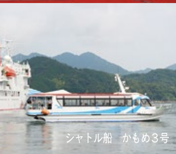
シャトル船 かもめ3号