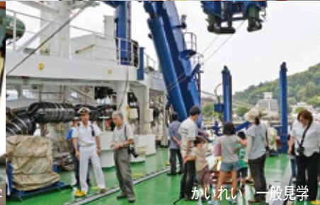
かいいい 一般見学