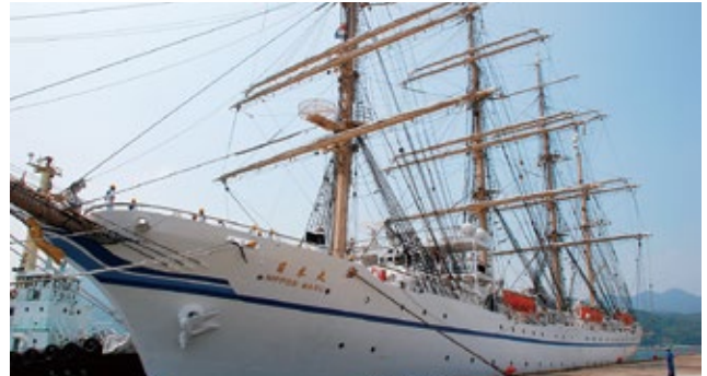
▲海の貴婦人「日本丸」

▶詳しくは、舞鶴市海フェスタ京都推進本部事務局(企画政策課内、☎66・0028)へ。