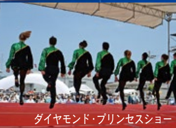
ダイヤモンド・プリンセスショー