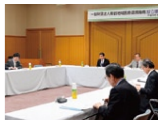
▲設立理事会の様子

救急医療体制の充実や病院間・病診間の連携の強化、医師確保対策を図ることを目的に市が設立する「一般財団法人舞鶴地域医療連携機構」の設立理事会を4月25日、商工観光センターで開催。機構の定款や今年度の事業計画が承認され、5月1日から業務を開始しました。