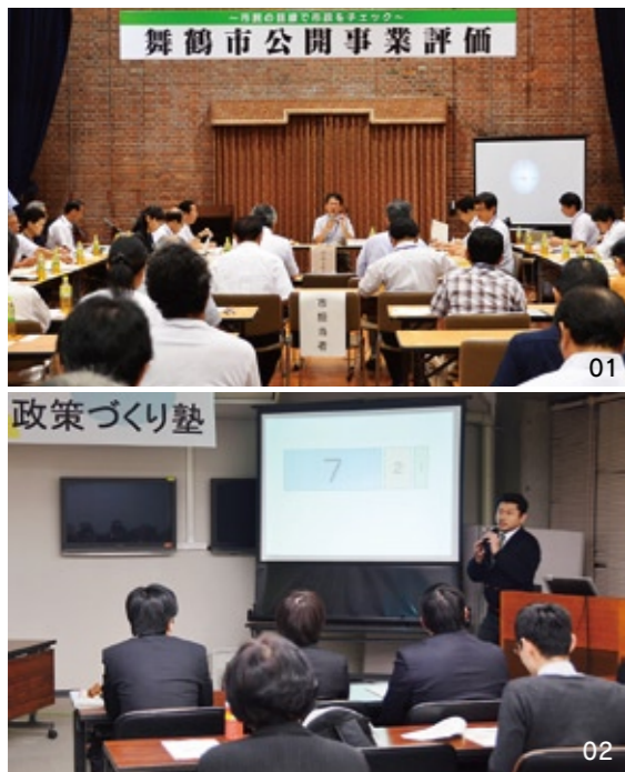
01. 公開事業評価で意見が飛び交う 02. 政策づくり塾で研究成果を発表

市政への市民の参画をさらに進めるため、若い世代の市政参画をきっかけとして公共政策について学ぶ「政策づくり塾」と、適正な行政サービスを提供するため、市の施策について意見をいただく「公開事業評価（市民による政策評価会）」を実施。塾生と市民判定員を募集します。 あなたの意見を市政に届けてみませんか。