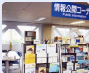
▲情報公開コーナー