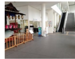
▲西駅交流センター1階