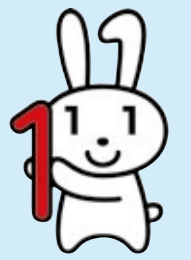
マイナンバーキャラクター マイナちゃん