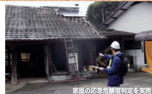
家屋の応急危険度判定を実施