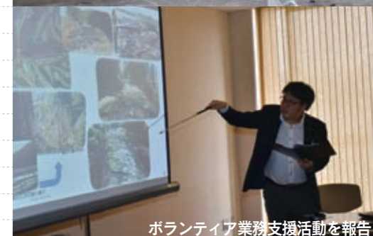
ボランティア業務支援活動を報告