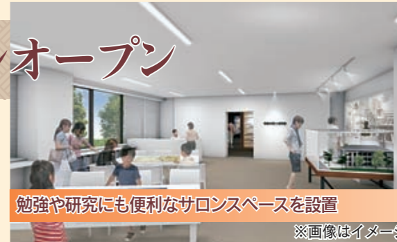
勉強や研究にも便利なサロンスペースを設置

開館当日は、12時から一般公開を開始します。 ▶詳しくは、文化振興課(☎66・1019、FAX62・9891)へ。