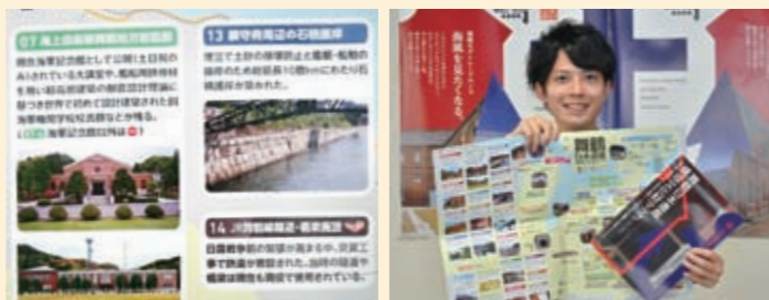
▲構成文化財を分かりやすく解説 ▲市内の日本遺産巡りに便利