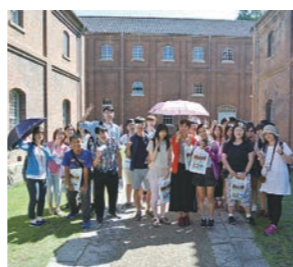
▲台湾からの観光客に、赤れんがパークを案内