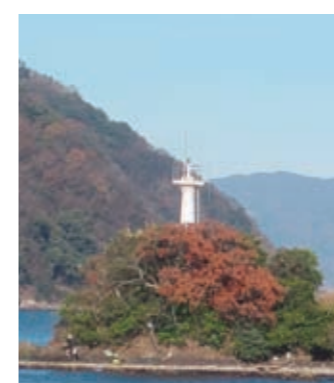
▲三本松鼻灯台