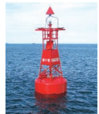
▲金ヶ埼東方灯浮標

のようじやが、よく見ると海の中にも数字や記号があるんじや。これは水深や海底の土の質、海岸地形、航路標識などが書かれておる。水色の部分は座礁防止のために水深が浅いことを示しておる。 船に乗る人たちは、必ずこの海図を見て航海をするんじや。海は陸のよつこ目印になる建物がない。特に夜は真っ暗で灯台や灯浮標などの光を目印にするしかないから。灯台や灯浮標はそれぞれ、光の色や点滅する時間などが異なり、海図に書き込まれておるから、それを見たら暗くても船の位置がわかるというわけじや。うまく覚えておるわ。 灯台は、太平洋戦争までは海軍