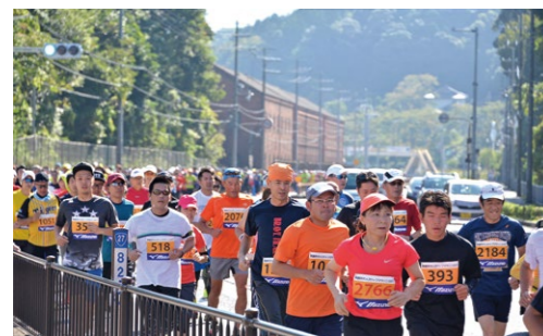
▲赤れんが倉庫群前