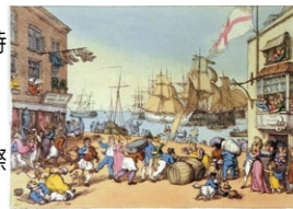
▲トマス・ローランド「ポーツマスポイント1811」

【場所】赤れんが5号棟 ▶詳しくは、みなと振興・国際交流課(☎66・1037)へ。