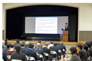
▲各種団体との意見交換会では市長が参加者へ説明(昨年の様子)

市長と各種団体との意見交換会や2000人市民アンケート、各施設や市ホームページでのアンケート、市民レビューでの意見交換、市パブリック・コメント手続制度による意見募集。