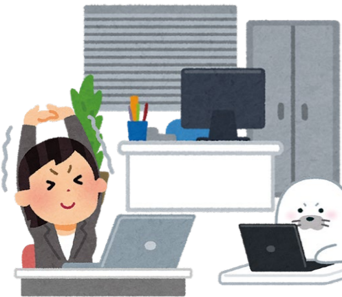
▲疲れたら「深呼吸」のタイミングで身体も伸ばそう

春は新しいスタートを切る季節。入学や就職、転職、異動など…。新鮮な気持ちや日々の忙しさのなか、知らない間に頑張りすぎていませんか？ 「五月病」という言葉があるように、身の回りの変化や年度替わりの忙しさを乗り切ってきた勢いや緊張感が緩み、疲れが押し寄せ、くることで、連休明けごろに「なんとなく体調が悪い」「学校や会社に行きたくない」「食欲がない」といった倦怠感が襲ってきます。 今年は超大型の10連休。超大型の五月病になってしまわないよう、隠れたストレスに耳を傾けてみましょう。 まずはストレスに気付いて 五月病は医学的な病名ではありませんが、ストレスが原因で引き起こされる精神的な症状の総称です。