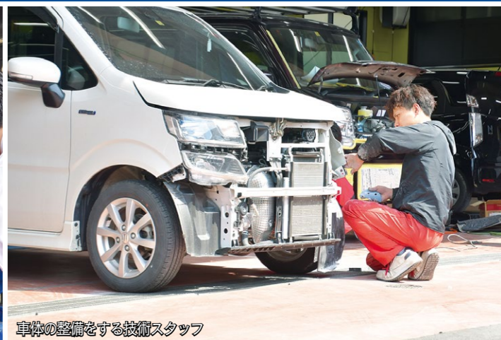
車体の整備をする技術スタッフ