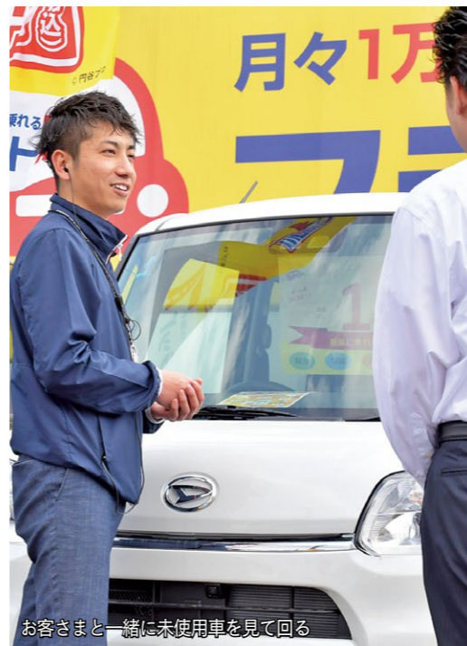
お客さまと一緒に未使用車を見て回る

自動車販売会社として2008年に創業。「日本一の軽自動車の販売会社」とするという目標のもと、現在では、自動車事業に留まらず、飲食事業も行い、グループ会社では不動産事業、海外事業、福祉事業など幅広い業務を展開。創業の地である舞鶴市を中心に福知山市、加古川市、さらには海外にも進出し、お客さまのニーズに合わせて、出会えてよかったと思えるサービスを提供している。