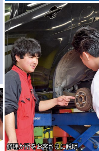
修理箇所をお客さまに説明