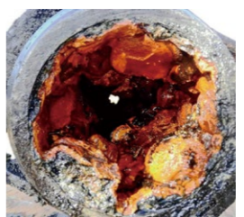
▲老朽化した水道管

◆経営戦略とは… 今後、人口減少により料金収入が減少する一方で、写真のような老朽設備が年々増加することが見込まれます。安定して水を供給するため、現状と将来の推計を踏まえ、中長期的な経営の方向性を示すための基本計画です。来年度から10年間の投資・財政計画を策定します。