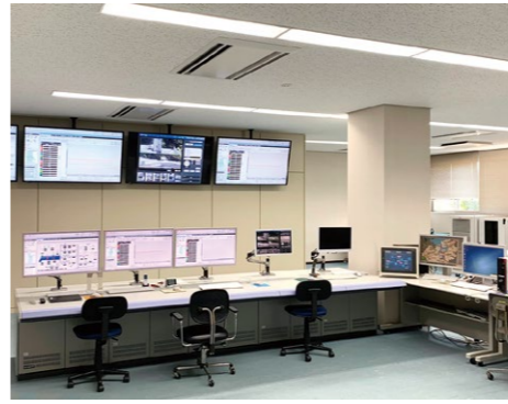
▲整備した上福井浄水場管理センター中央監視室

【上福井浄水場施設更新事業】 2億2,052万円 【総事業費 約25億1,000万円】 市の給水量の約85%を担う上福井浄水場は、管理センターの老朽化が著しく耐震性がないため、更新事業を進めています。管理棟とポンプ棟が完成し、ポンプなどの機械設備や操作盤、監視制御盤、受変電設備などの電気設備の整備が完了しました。 今年度は、場内整備や旧管理棟の解体工事などを行い、年度内の完成を目指しています。