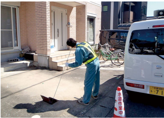
▲メーターに漏水音がないか確認中

漏水は、貴重な水が無駄になるため、早期に発見し修理することが大切です。今年度から、給水管漏水の調査に重点を置き、調査職員が随時、各家庭や事業所などの水道メーターを巡回し、漏水音の有無を調べています。 職員が敷地の中に入らせていただきますが、ご理解とご協力をお願いします。