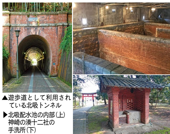
▲遊歩道として利用されている北吸トンネル ▶北吸配水池の内部(上) 神崎の湊十二社の手洗所(下)

◆数が多い 市内には1~4もの赤れんが建造物が残っており。これは、鎮守府のあった旧軍港4市の横須賀・鳥羽・佐世保・舞鶴の中で最も多いぞ。すごいじゃろ？ ◆集中している 赤れんがパークを中心に、れんが建造物が集中してある。鎮守府を開庁するために、軍港を中心にまちを造ったからで、当時の最新の技術で赤れんがを使った建造物をたくさん造ったんじや。 ◆身近な場所にある 鉄道の橋脚やトンネルなど、身近な場所にもれんがは使われておるんじや。また、倉庫として利用されていた建物が、平成24年に「赤れんがパーク」として生まれ変わり、イベントや成人式などにも利用されておるのは知っておるじゃろ。赤れんが倉庫は横浜や小樽が有名じゃが、単な