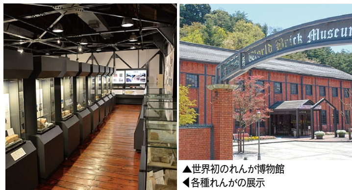
▲世界初のれんが博物館 ▲各種れんがの展示

設、事務所、砲台、トンネル、庁舎、講堂、橋梁などのさまざまな種類が残っており。このように「赤れんが」は、周りを見渡せば、わしらの身近にたくさんあるんじや。赤れんが博物館も、行ってみてくれ。