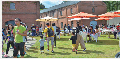
「明治150年」関連事業【3,194万円】 本市の魅力発信と交流人口拡大を目的に、明治150年をテーマにプロモーション事業を展開