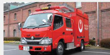
消防施設整備事業【4,451万円】 防火水槽のフェンス改修、消防ポンプ自動車の更新、放射線測定器の校正、小型動力ポンプ搬送車2台を整備