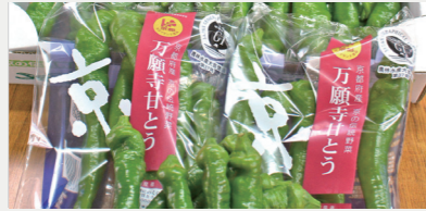
万願寺甘とう振興事業【908万円】 地理的表示（GI）保護制度に登録された万願寺甘とうの生産力の向上と消費拡大を支援