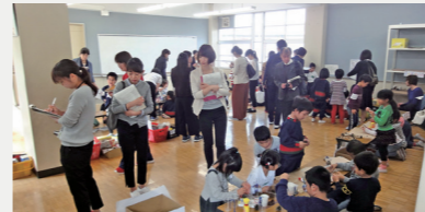
乳幼児教育ビジョン推進事業【681万円】 乳幼児教育ビジョンに基づいた乳幼児教育の質の向上研修実施や保幼小連携の推進