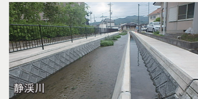
浸水対策事業（一般会計）【8,713万円】 雨水処理事業（下水道事業会計）【5,158万円】 府の高野川整備事業と連携し、西市街地の内水対策を推進。また、エリアを東地区にも拡大し、東西市街地の浸水対策を強化。