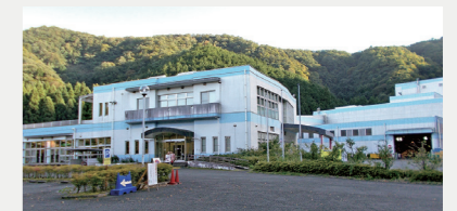
リサイクルプラザ施設改修事業【6,842万円】 ペットボトルの単独分別収集や施設の安定稼働のため、プラごみ分別の設備を導入