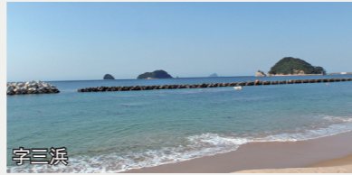
漁港海岸保全対策事業【2,473万円】 台風や冬季風浪による波浪からの海岸の防護や砂浜の浸食対策などを実施