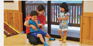
保育士の処遇改善事業費補助【2,004万円】 人材不足解消を目的に民間園保育士などの処遇改善に市独自で支援を実施