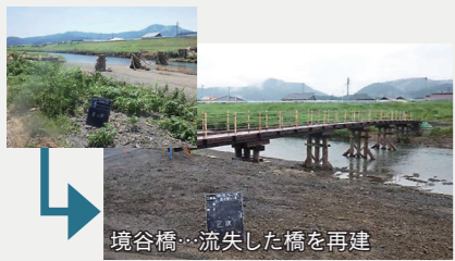
境谷橋…流失した橋を再建