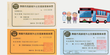
高齢者外出支援事業【1,830万円】 75歳以上を対象に、バス、京都丹後鉄道、タクシー利用時に利用できる割引乗車券を販売