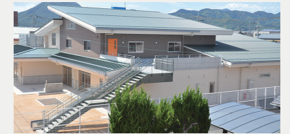
公立認定こども園整備事業【3億4,333万円】 幼保連携型認定こども園の整備に係る建設事業費（平成31年4月開園）