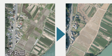
基盤整備促進事業【2,255万円】 ほ場整備を実施し、農業経営基盤の確立と農地集積を推進