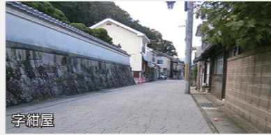
中心市街地活性化事業【4,417万円】 西地区の城下町のまちなみを生かしたまちづくりとして、歴史のみちづくり整備工事などを実施