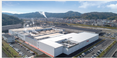
企業誘致実現プロジェクト事業【3億3,156万円】 雇用を伴う新規立地や設備投資に対する助成を市内全域に拡大し実施