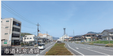
幹線道路整備事業【6億1,210万円】 国道・府道を補完する幹線市道（引土境谷線・和泉通線）の整備