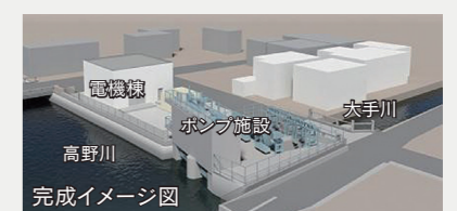
河川整備事業【1億1,169万円】 浸水被害の解消に向けた市内の河川整備（護岸工事）など