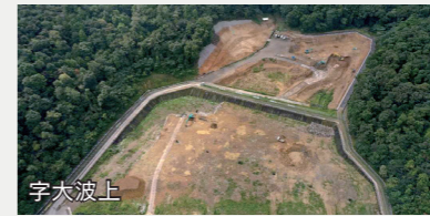
次期最終処分場整備事業【2,521万円】 令和3年度中の供用開始を目指し、建設工事に着手