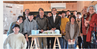
まちなか暮らし推進事業【590万円】 高専や自治会長など関係者と連携し、まちなかの空き家をリフォームする「居住促進住宅」整備事業を推進