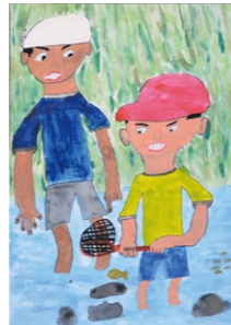
▲立花駿翔さんの作品

▶詳しくは、舞鶴の川と海を美しくする会・まいづるクリーンキャンペーン実行委員会事務局(いずれも生活環境課内、☎66・1064)へ。