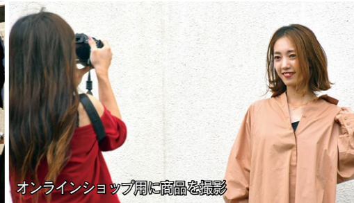
オンラインショップ用に商品を撮影