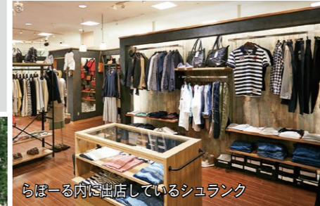
らぼーる内に店舗しているシュランク