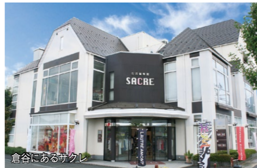
倉谷にあるサクレ

昭和48年に婦人服・子ども服小売店として創業。アパレル事業だけでなく、ユニフォーム事業やインターネット事業も展開。スローガン「イロトリドリの幸せを」掲げ、お客様に服飾品だけでなく、人と人の「つながりとぬくもり」も提供している。