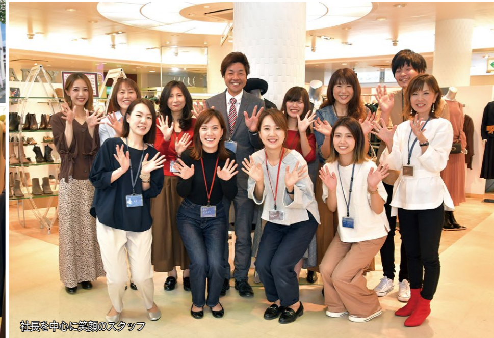
社長を中心に笑顔のスタッフ