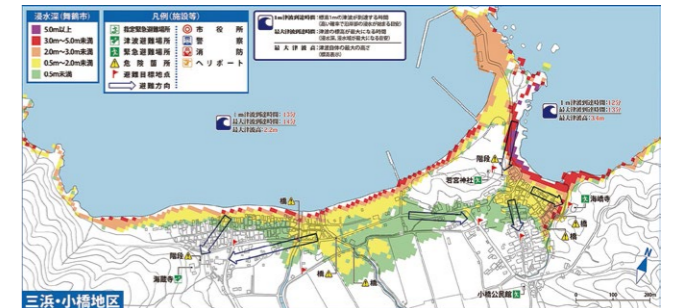
▲三浜・小橋地区の津波ハザードマップ

市では、津波ハザードマップを作成し、ホームページで公開しています。津波による浸水の深さや到達時間の目安も掲載。住んでいる地域や通勤・通学場所、経路を確認してみてください。下コードからもアクセス可。