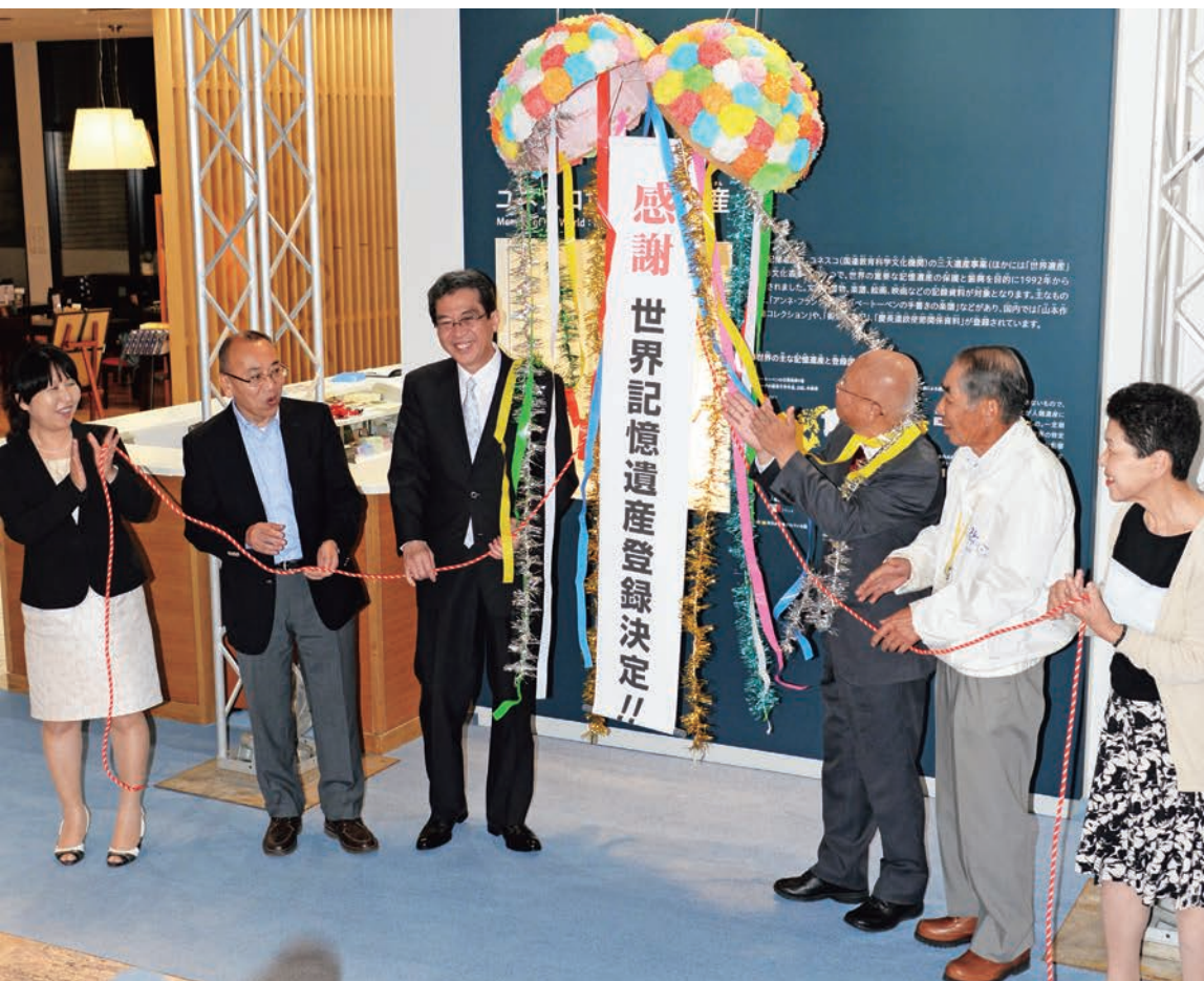
▲ユネスコ世界記憶遺産登録決定を喜ぶ

第7次舞鶴市総合計画に基づき、まちづくりの方向性や市の取り組み施策・事業をお伝えする「市政の今」。今回は、引き揚げの史実の次世代への継承から次世代による継承についてお伝えします。