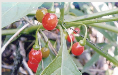
ハダカホウズキ(ナス科)

本州以南の山地の木陰に生える多年草。高さは60~90センチで、枝分かれして広がる。葉は互生し、楕円形で長さは8~20センチ、先は尖り、下部は細くなって柄となる。