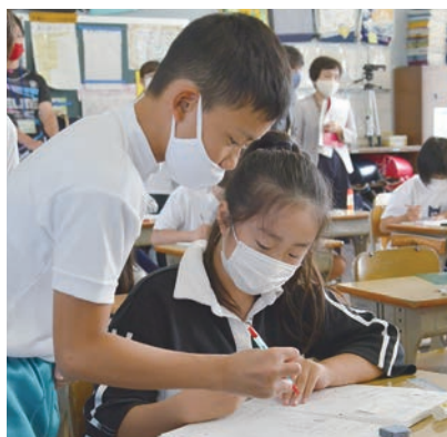
▲教え合いは伝え方を鍛え復習にもなる

授業も家庭学習も、児童生徒が主体的に取り組むことで、将来にわたって役に立つ「粘り強く課題を解決する力」や「コミュニケーション力」などを育てることにつながります。