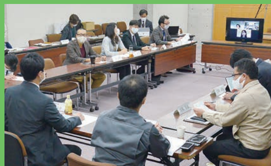
▲会議では全国で活躍する市出身者とも意見交換

舞鶴シティブランディングプロジェクトでは、地域の魅力に詳しい地元事業者や、市内高等教育機関の教員、若手市職員などさまざまな主体でプロジェクトチームを結成。「舞鶴を元気にしたい」という思いで、本アンケートの作成や配布はもちろん、ブランディングに一体となって取り組んでいます。