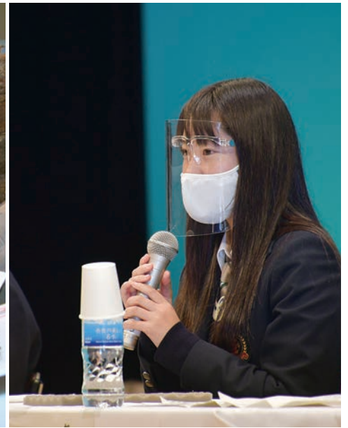
平和未来フォーラムでディスカッションに参加する日星高の生徒(右上) 修学旅行生を案内する若浦中の語り部(左上) 舞鶴引き揚げの日折り鶴アート(右下) 新舞鶴小で行われた引き揚げの体験授業(左下)