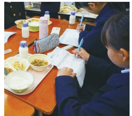
▲給食配膳中の様子(福井市)

昭和26年から県独自で学力調査を実施するなど、昔から教育に力を入れてきた福井県では「学ぶことは大切」という意識が感じられました。学力が注目される福井県ですが、保護者の皆さんは「勉強が一番大事」ではなく「学校では勉強以外のこともしっかりと学んでほしい」という願いを持っていて、社会で必要とされるマナーやモラルについて、家庭と学校が協力して育んでいる印象があります。