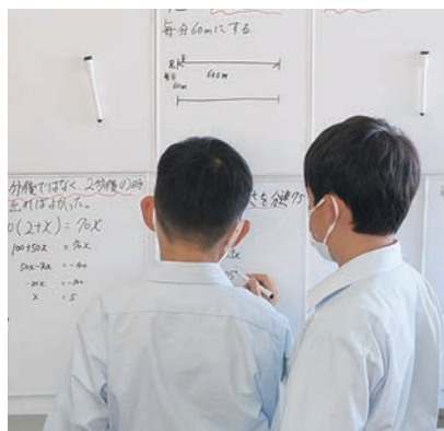
▲授業後も生徒同士で議論が始まる

ので「自分から相手に聞こえる声でありさつをする」「自己決定ができる」「思いを自分の言葉で話せる」などの自分で考えて行動する力も養うことができる授業だと思っています。児童からも「友達が自分とは違う考え方をしていることが聞けて面白い」と楽しんで学んでいる様子がうかがえます。また、どの学年・教科でも探究型の授業が行われているため、学年が上がっても初回の授業からスムーズに授業を受けられる体制がありました。家庭での自主学習は小学一年の6月から始まり、保護者がチェックしたものを提出します。高学年になると、苦手科目に自主学習で取り組む様子が見られ、小さい頃から学習の習慣を身に付けることの大切さを感じています。子どもの学習中、保護者の皆さんも、同じ場所で仕事や読書をするなど、一緒に過ごしてあげると、より良いかと思えます。 家族や地域が寄り添う大切さ(服部先生) 中学校でも、探究型授業を行い、生徒が「今日の授業で何が身に付いたのか」が実感できるようになっています。 生徒は部活動後の限られた時間をうまく活用し、集中して自主学習に取り組む能力を身に付けており、小学校から積み重ねてきたことが、中学校での学習にも生かされていると感じられました。 生徒は、地域の清掃や祭りへの参加意欲も高く、行事やスポーツ大会のあいさつでも「地域に応援されるように」「地域