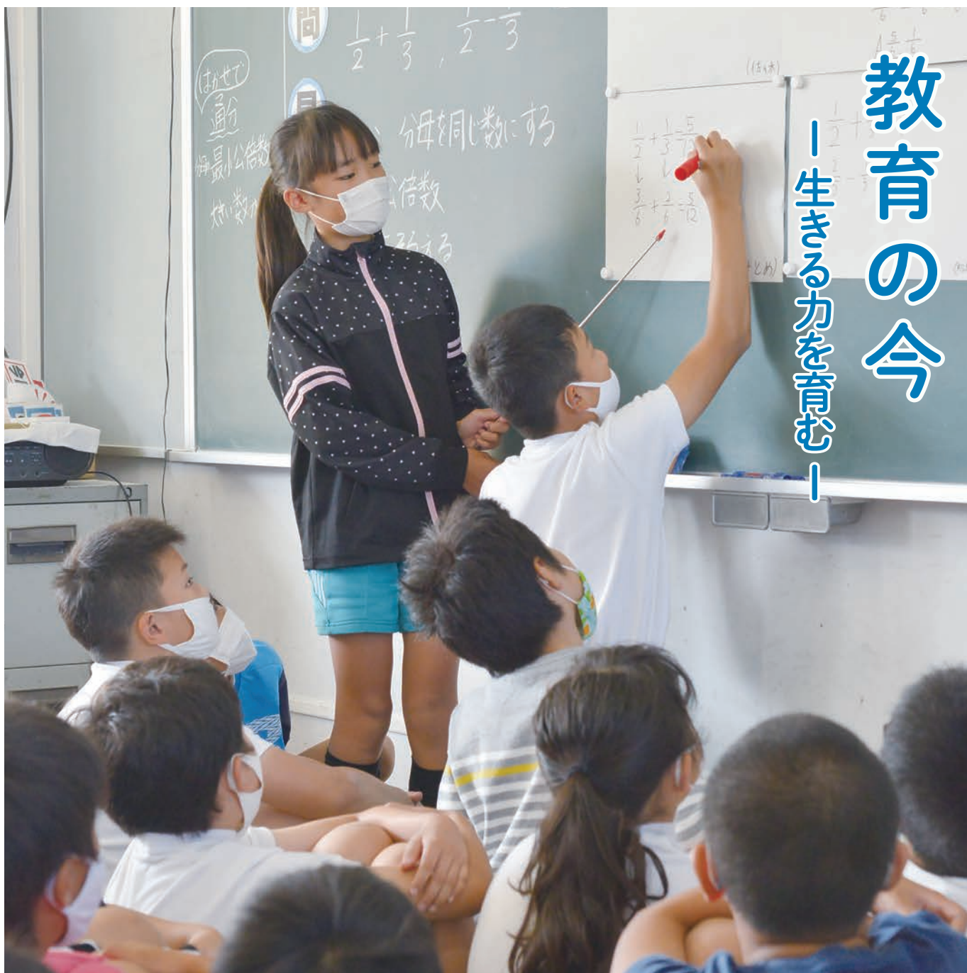
▲授業の中で、自分の考えを説明したり友達と交流したりすることで、互いの考えを共有し、さらに理解を深める

世の中が日々、目まぐるしく変化しているように、学校や教育も時代と共に変化しています。本市の教育は、子ども達が5年先、10年先の未来に、社会で生きる力を育むことを目指しています。本市の「ふるさと舞鶴を愛し、夢に向かって将来を切り拓く子ども」を育てる「教育の今」を紹介します。