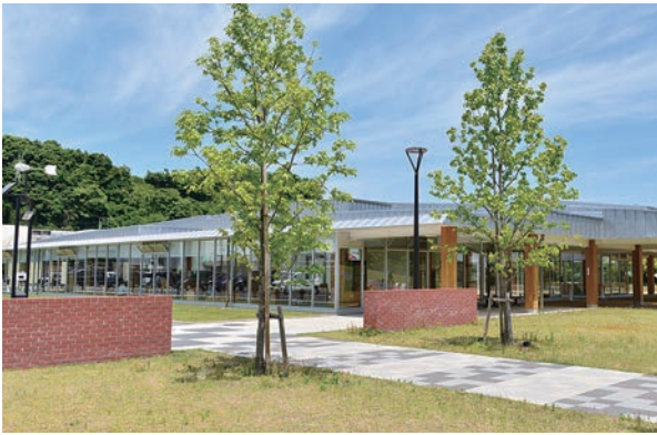
▲子育て交流施設「あそびあむ」

【提出された意見の取り扱い】 提出された意見などを考慮して最終案を作成。また、意見の概要と意見に対する市の考え方を整理し公表します(氏名などは公表しません)。 ▼詳しくは、子ども支援課(☎66・1008、FAX62・7957)へ。