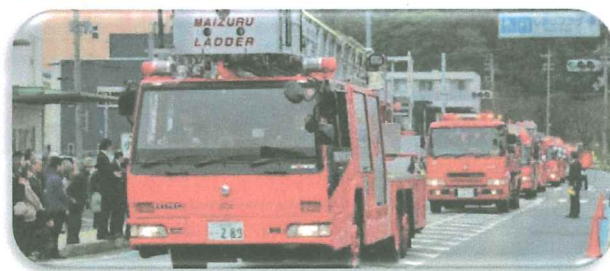
海上自衛隊舞鶴音楽隊を先頭に消防車両がパレード