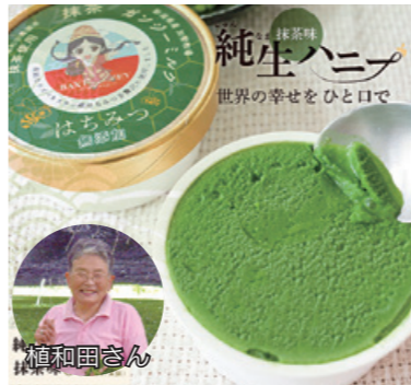
【提供】TOKU株式会社 (東京都中野区白鷺1-30-7、☎03-5327・8705)