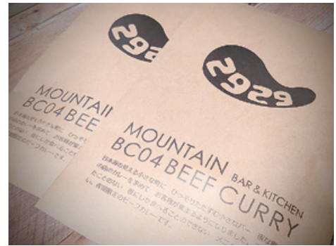
【提供】マウンテンバーアンドキッチン (堀上33番地、☎75・2011)