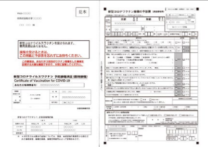
▲4回目接種券(予診票と一体型)

3回目接種日から5か月を経過する60歳以上の人に4回目接種券と集団接種意向調査の案内を6月以降に順次送付。届いた意向調査に回答し申し込み