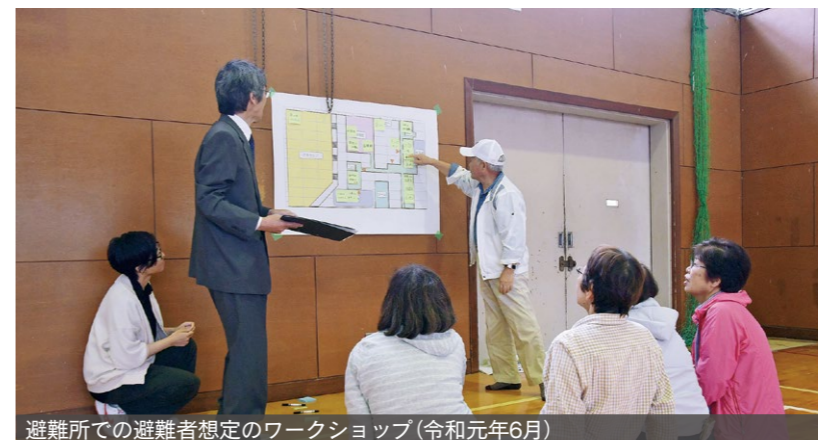
避難所での避難者想定ワークショップ(令和元年6月)