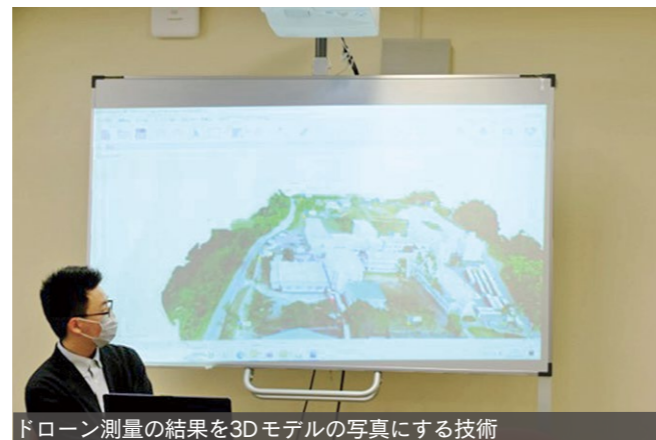
ドローン測量の結果を3Dモデルの写真にする技術