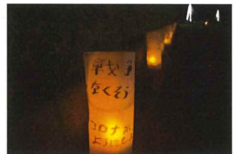
↑キャンドルイルミネーション (昨年の様子)