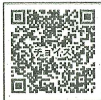
ふるさとチョイス