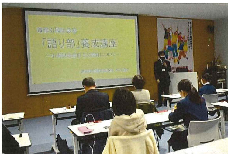
▲昨年の語り部養成講座の様子