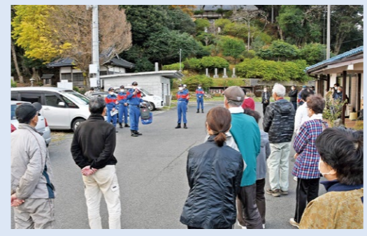
《危機管理・防災課》

11月27日、PAZに準じる地域の成生地区のほか、三浜地区、小橋地区、三笠小学校で、京都府原子力総合防災訓練を実施しました。 今年度は、各自治会をはじめ、東・西大浦消防団、舞鶴警察署など、約250人が参加。成生では、津波との複合災害を想定し、防災行政無線や自動起動ラジオによる情報伝達の後、高台への避難訓練を実施。続いて、高浜発電所の事故進展に伴う要配慮者の避難訓練と田井原子力防災センターの放射線防護対策設備稼働訓練を実施しました。三浜・小橋では、津波避難訓練の後、屋内退避訓練を行いました。 また、3年ぶりとなる住民参加による避難訓練を実施した三笠小学校では、検温から安定ヨウ素剤の配布、避難用のバス乗車までの流れを確認しました。 今後も実効性のある訓練を引き続き実施し、地域住民の安全を確保していきます。