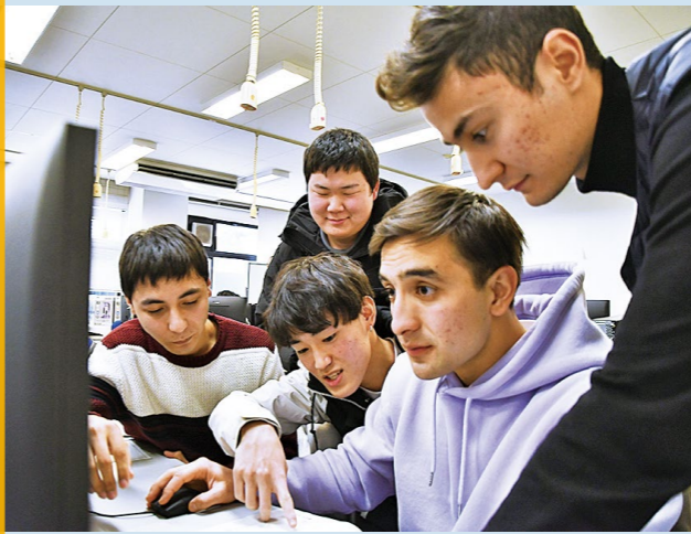
▲パソコンで製図をする授業の様子

ンドです。日本語も上達し、勉強を教えることもありますが、放課後はバスケットボールをするなど学校生活を一緒に楽しんでいます。