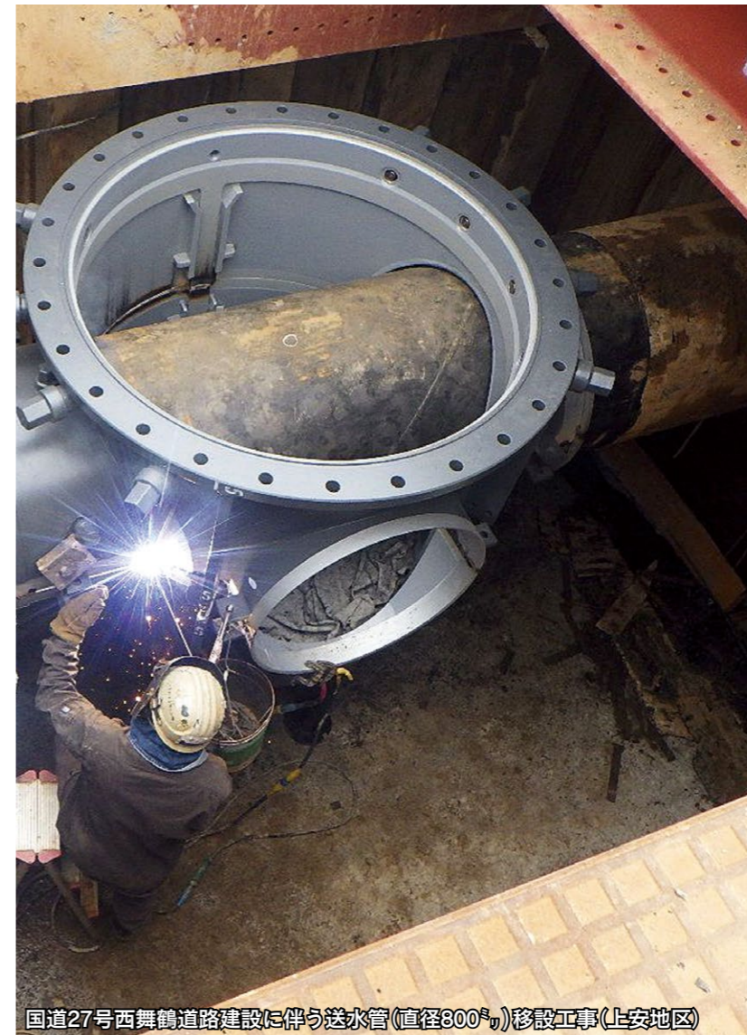
国道27号西舞鶴道路建設に伴う送水管(直径300φ)移設工事(上安地区)

また、天ぷら油などの廃油も、配管に付着して詰まりや臭いの原因になるので、少量の油でも必ず拭き取るなどして下水道管には流さないでください。