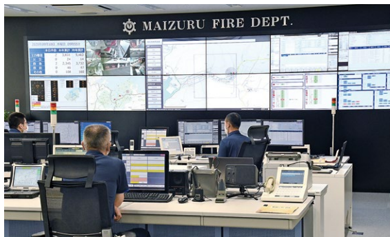
▲舞鶴市消防本部の消防指令センター