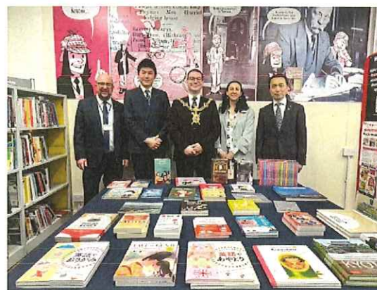
▲ポーツマス市内の図書館で開催した相互寄贈図書のお披露目式（令和6年2月11日）

今年度、舞鶴市とポーツマス市の姉妹都市提携 25 周年を迎えるにあたり、両市・両国にまつわる図書の相互寄贈を実施。本年 2 月、舞鶴市代表団がポーツマス市を訪問した際には、ポーツマス市内の図書館で相互寄贈図書のお披露目式を開催した。