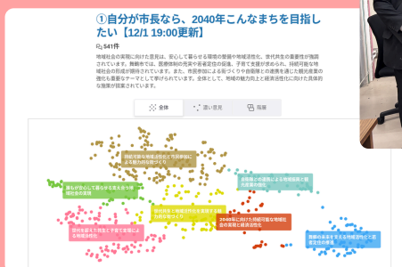
▲実際の広聴AIを使った回答結果