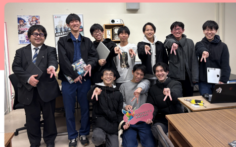
▲舞鶴高専プログラマーズ コミュニティークラブの皆さん