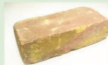
ナボイ劇場のれんが