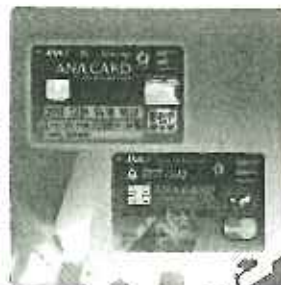
ANA Mileage Club