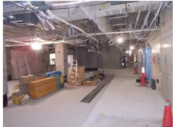
<1階 JA彩菜館・事務所前廊下>