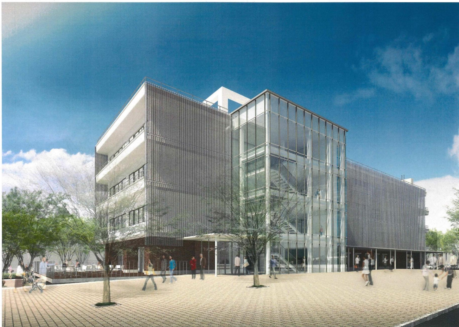
西棟イメージパース