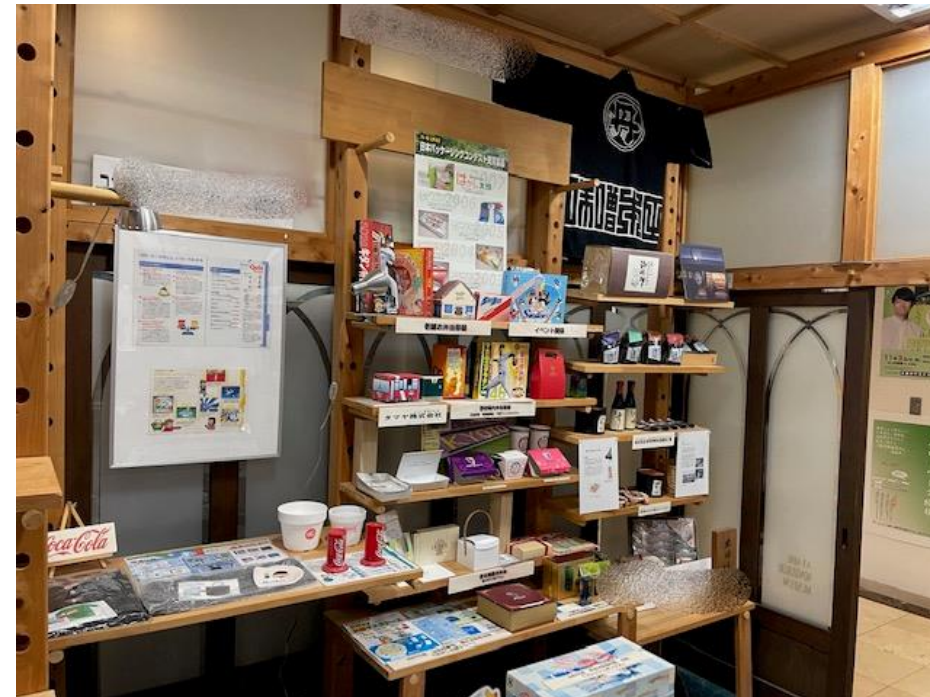
舞鶴市商工観光センター 1階フロア