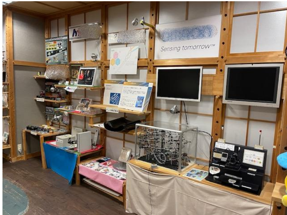
綾部市 I・Tビル 内部