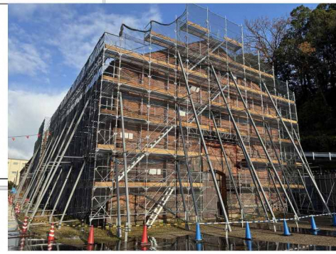
現状(仮設足場設置状況)